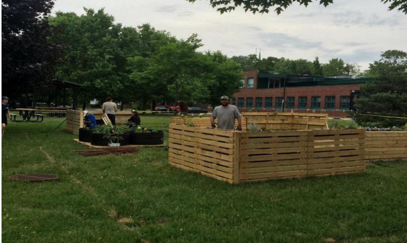
Photo : Le Parc St-Denis, un espace idéal pour cultiver et rencontrer !

Ce magnifique jardin en bacs surélevés a pris naissance bien tardivement malgré notre calendrier d'agriculteurs prévoyants. Toute notre planification en amont (semis à l'intérieur, schéma d'aménagement des planches de cultures, achat de plants) a été revisitée à cause des délais occasionnés par l'attente d'analyses de sol et du verdict de contamination. Nous devons alors revoir nos connaissances et notre conception de jardin en plein sol pour celle en contenants variés.