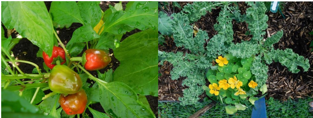
Photos : Légumes du jardin collectif

Nous avons récolté des fines herbes, piments forts, courgettes, concombres et aubergines. Nos tomates vertes en abondance. Les petits pois, la moutarde rouge et les radis japonais ont remporté la palme du succès. Comme vous pouvez le constater, l'expérimentation de plantes méconnues faisait partie de l'expérience.