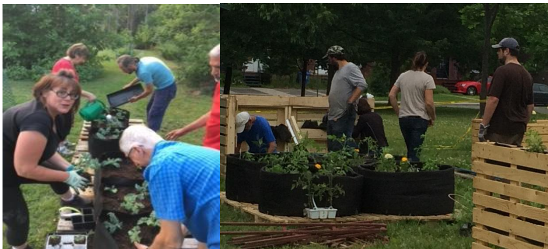
Photos : Bénévoles participants aux activités de plantations au jardins Serenity et au jardin collectif Saint-Denis

Ce jardin a été entièrement bâti par des volontaires soucieux de partager connaissances, savoir-faire sur l'agriculture urbaine et corvée de travaux de construction. Ils ont été de fiers ambassadeurs de leur projet auprès d'un public curieux et intéressé par notre initiative.