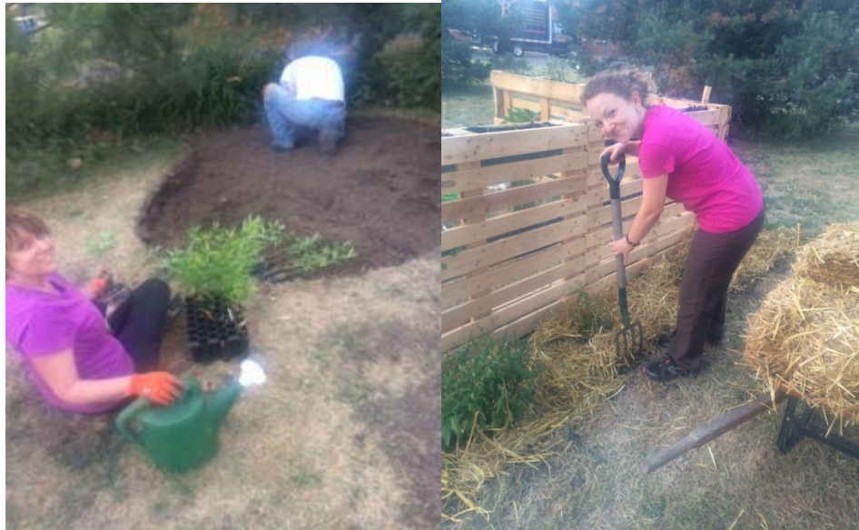
Photos : Jardin d'asclépiades (pour monarques) et vivaces pour pollinisateurs